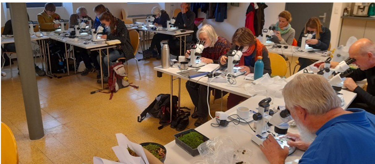
Bestimmungsarbeit an Binokularen und Mikroskopen

www.nabear.de > Programm > offene Angebote